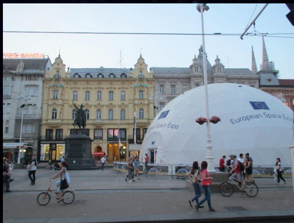
Zagreb, Trg bana Josipa Jelačića, 11. lipanj 2015. ... večer prije otvaranja ...