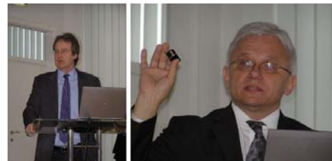
Slika: Njegova ekscelencija veleposlanik g. David Slinn (lijevo), prof. Bačić i INS/GNSS MEMS mjerni uređaj(desno).

U organizaciji HGK i Veleposlanstva Ujedinjenog Kraljevstva Velike Britanije i Sjeverne Irske u Republici Hrvatskoj održana je konferencija „Korištenjem satelitskih tehnologija do pouzdanih podataka i boljih poslovnih rezultata“ na kojoj su predstavnici državnih institucija i javnih sustava bili u prilici čuti predavanja o recentnim dostignućima satelitske tehnologije s posebnim naglaskom na globalne navigacijske satelitske sustave i satelite za daljinska opažanja. ... (više)